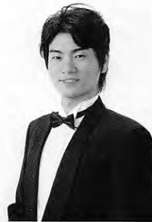
ガストン 川崎 慎一郎

パリの高級娼婦ヴィオレッタは、富豪の息子アルフレードから求愛を受け、享楽的な生活をやめるように諭されます。真摯な愛に心動かされたヴィオレッタはパリ郊外の別荘で二人で暮らし始めるのですが、これを快く思わないアルフレードの父、ジェルモンは娘の縁談に差障りがあると、ヴィオレッタに彼の元から去る様に説得するのです。自ら身を引きパリに戻ったヴィオレッタ。裏切りと邪推したアルフレードはフローラの夜会でヴィオレッタを罵倒して、男爵との決闘となります。男爵は怪我を負い、アルフレードは外国で暮らす事になりました。ヴィオレッタは持病の肺病が悪化して、死の床にありました。そこへ父親から真実を知らされたアルフレードが駆け付けます。しかし、時すでに遅くヴィオレッタは息を引き取ります。